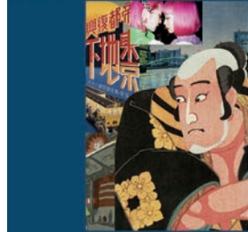
TOKYO STORIES Spannende künstlerische Begegnung