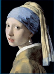
VERMEER DIE BLOCKBUSTER-AUSSTELLUNG