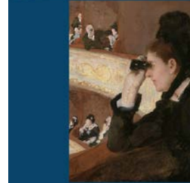
MARY CASSATT PORTRÄTS MODERNER FRAUEN