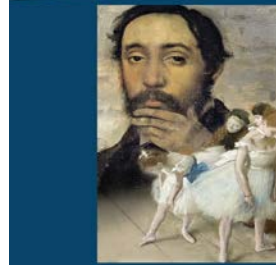
DEGAS LEIDENSCHAFT FÜR PERFEKTION